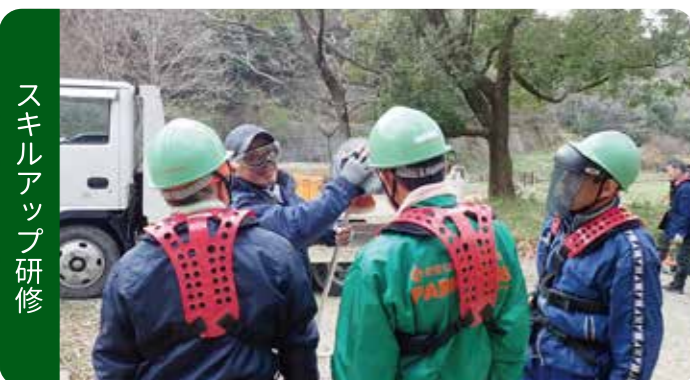
スキルアップ研修