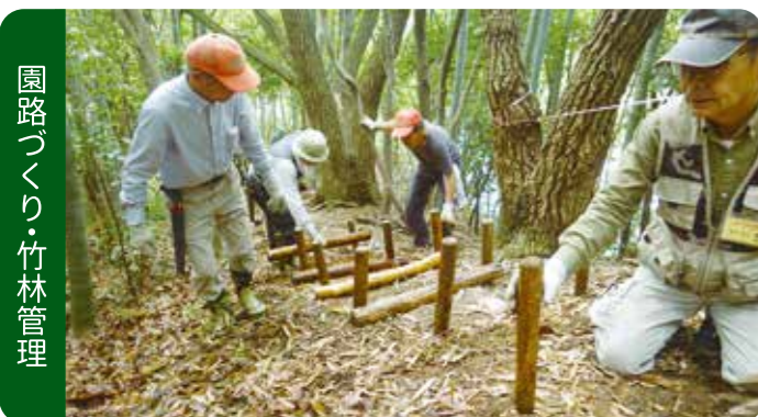
園路づくり・竹林管理